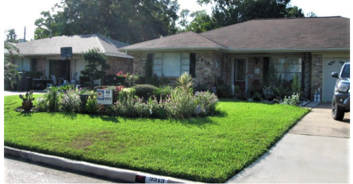
Felicitaciones a 5519 Whispering Creek De septiembre de 2019 Hermoso patio del mes!

Niveles de membresía (Uno Año): el/la Miembro $50 ____ Miembro generoso $100 ____ Miembro de más de 65 años, $40: ____ Miembro generoso de más de 65 años, $85 ____